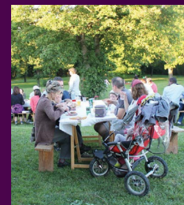
Restauration et buvette sur place