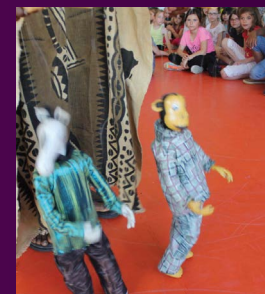
Marionnettes (Eric Zongo)