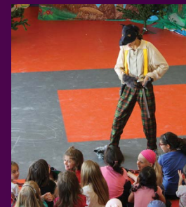
Théâtre d'enfants (Compagnie Au Fil des Fées)