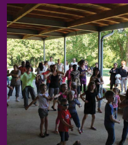
Participation du public aux démonstrations de danse